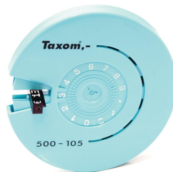
500-105 TAXOM Printer